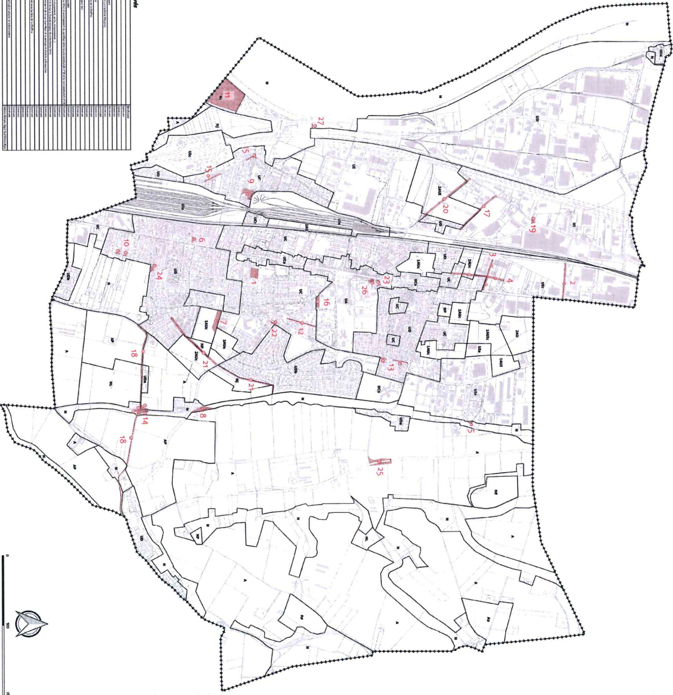
Liste des emplacements réservés